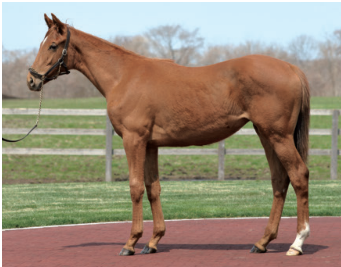
マツリダゴッホ 鹿毛 2003年