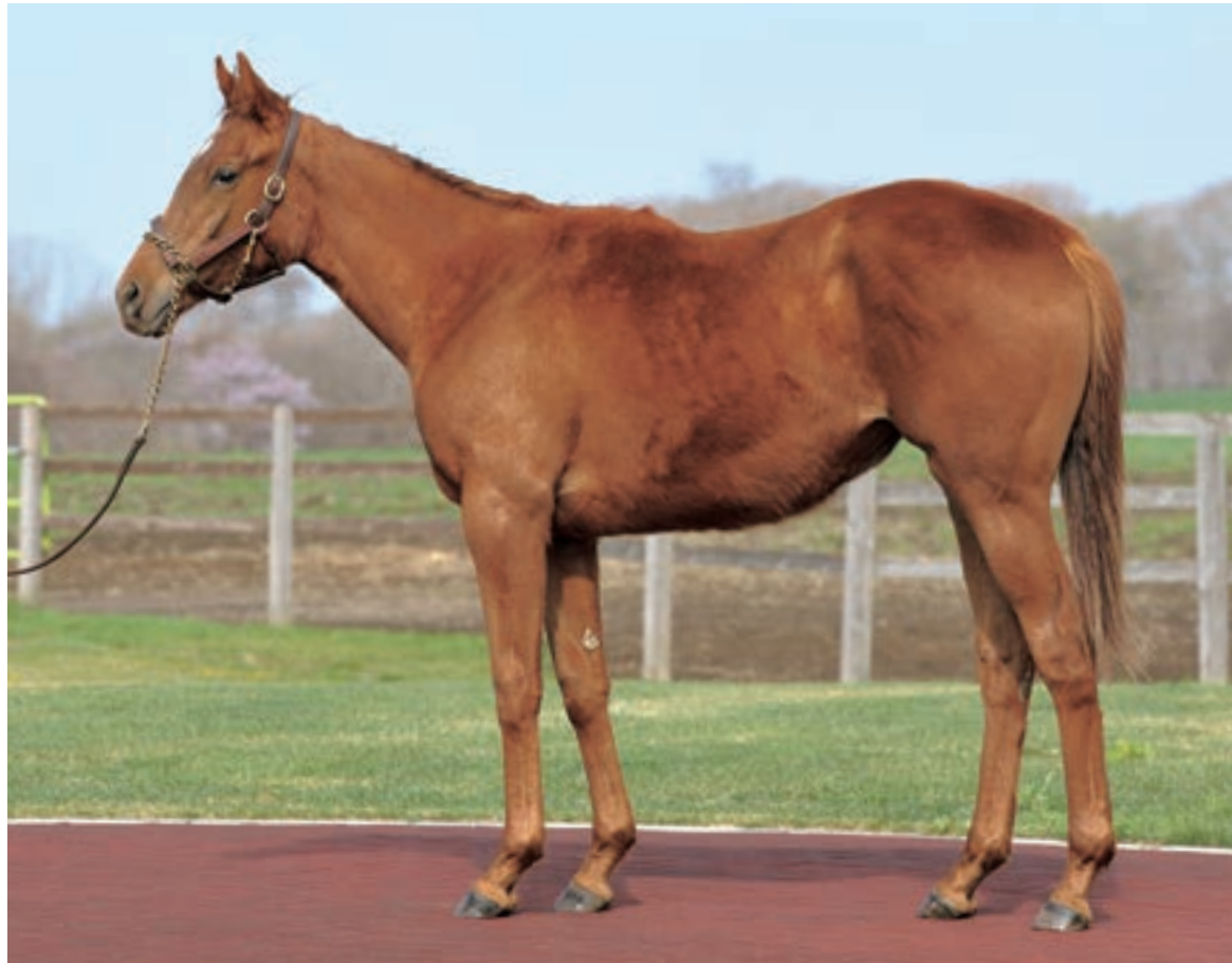
メイショウボーラー 黒鹿毛 2001年

父 メイショウボーラー 牝 栗毛 2013年2月19日生まれ コスモヴェーファーム